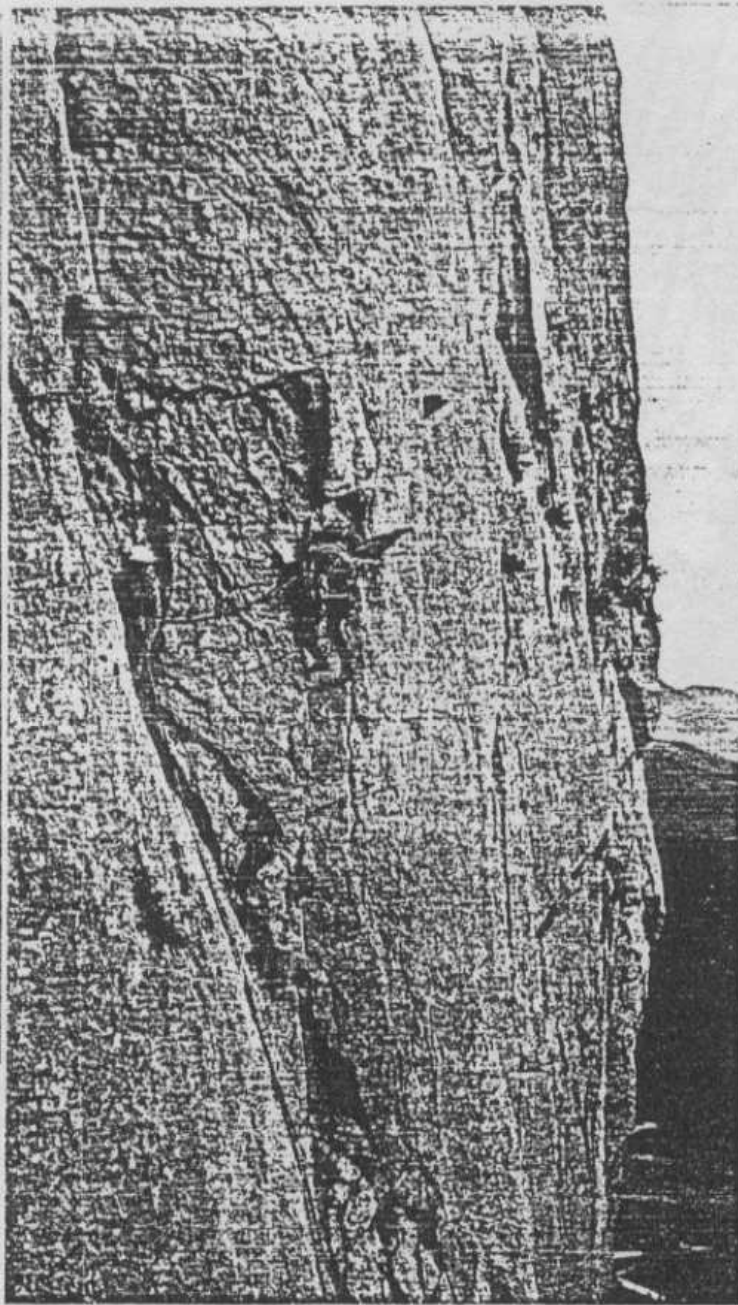
Lebargorri (Atxarte).

sicamente son fuertes y están bien dotados para superar las frustraciones. En algunos casos hay una tendencia excesiva a la soledad. Confiados, independientes y auto-controlados, soportan bien las estrecheces. Tienen una pronunciada necesidad de riesgo y de emociones fuertes. Son desconfiados y suspicaces con los demás, y suelen ser tachados de antisociales.